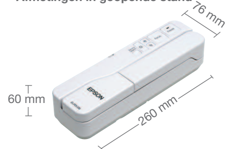
Afmetingen in gesloten stand